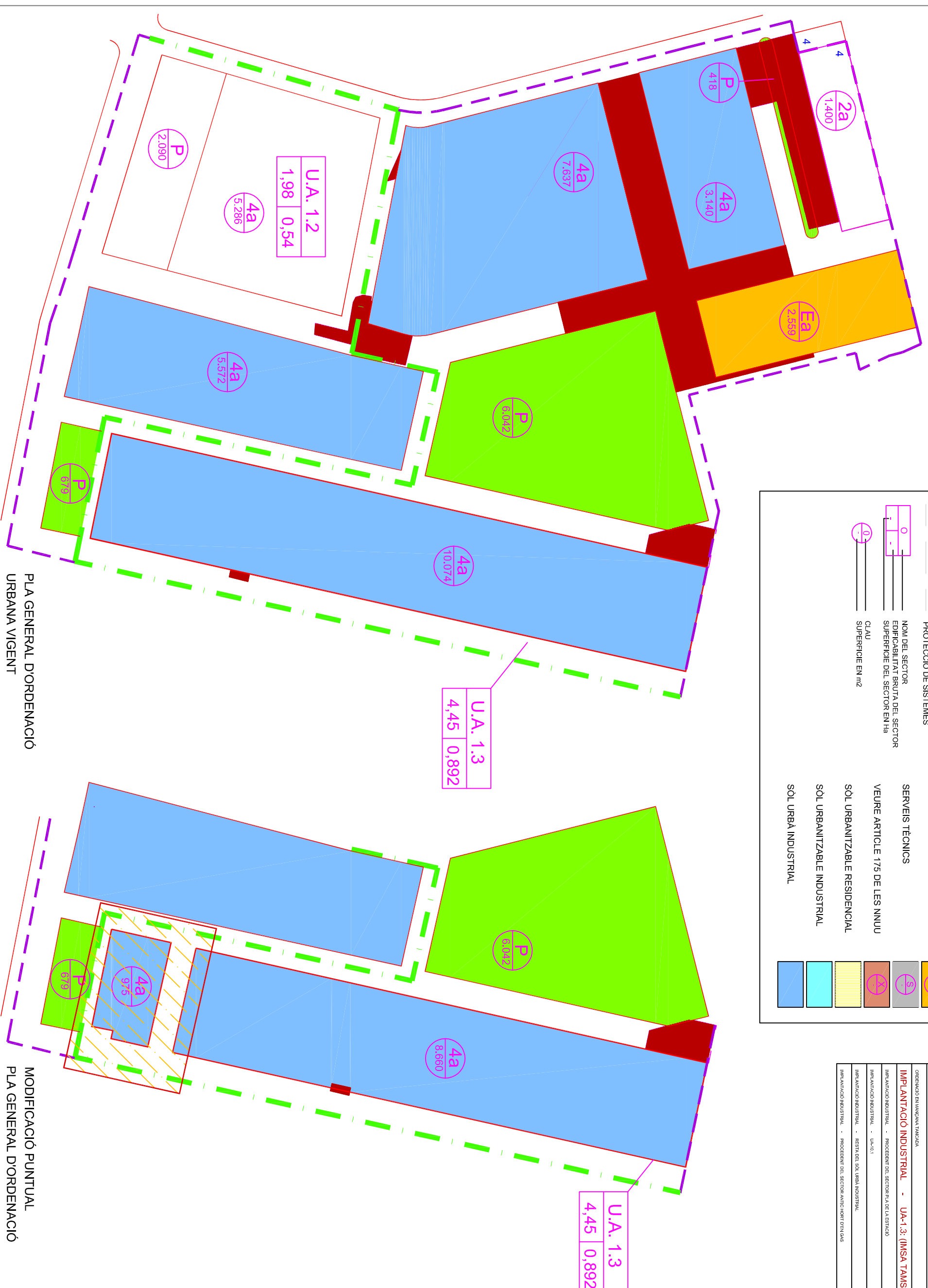
PLA GENERAL D'ORDENACIÓ URBANA VIGENT